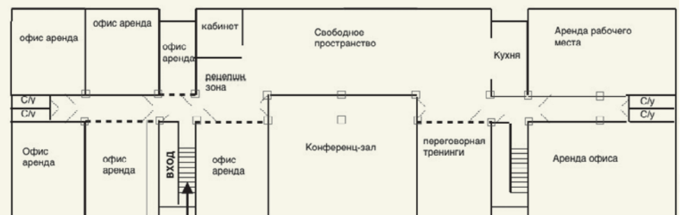
ПЛАН ПОМЕЩЕНИЙ В ДОМЕ НОМЕР 9

В ДОМЕ НОМЕР 9 расположены 8 офисных помещений площадью от 11 до 75 квадратных метров, 2 переговорные комнаты по 38 квадратных метров, конференц-зал 100 квадратных метров, а также свободная зона площадью 160 квадратных метров. Организована общая кухня.